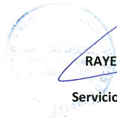
RAYEN MARÍA INGLÉS HUECHE Directora Nacional Servicio Nacional del Adulto Mayor